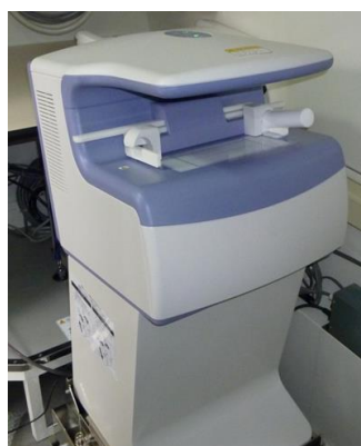
[骨密度測定装置 (DXA法)]