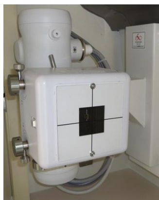
[胸部集検用X線発生装置]